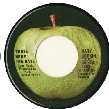
[CAPP 1801.01 A]