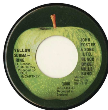
[CAPP 1800.01 A]