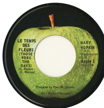
[CAPP 2.01 A]