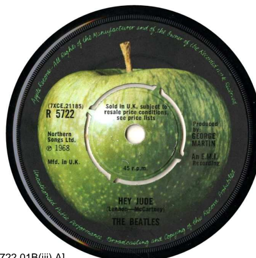
[APP 5722.01B(iii) A]

En Grande-Bretagne, la majorité des 45 tours Apple ne sont pas accompagnés de pochette illustrée. Par ailleurs, la plupart de ces disques sont offerts en deux versions chez les détaillants.