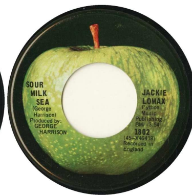
[CAPP 1802.01 A]