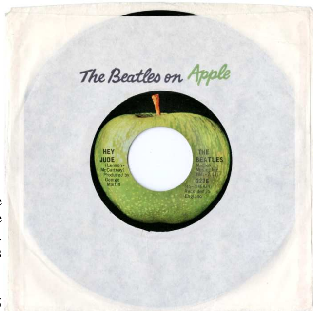
[CAPP 2276 A] APPLE 2276 HEY JUDE / REVOLUTION