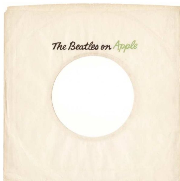
[CAPP 45.S68 A]

Alors qu'en Angleterre et aux États-Unis, les 45 tours des Beatles sont présentés dans des enveloppes noires luisantes avec la mention superposée 'The Beatles on Apple' en lettres attachées de couleur verte, cette dernière est étalée sur papier blanc au Canada.