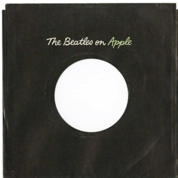
[APP RS.1A B]