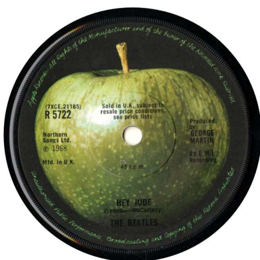
[APP 5722.01A(i) A]