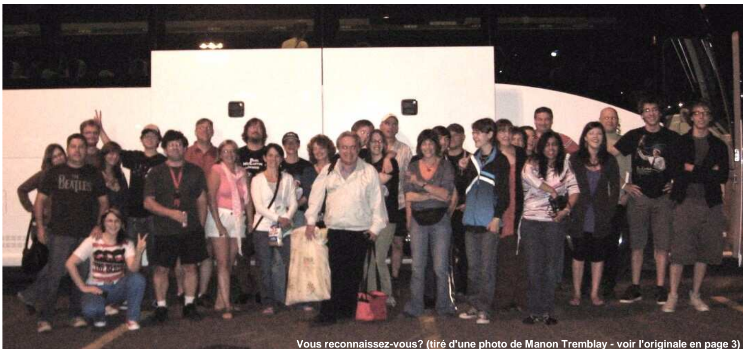
Vous reconnaissez-vous? (tiré d'une photo de Manon Tremblay - voir l'originale en page 3)

L'autobus a quitté Montréal le vendredi 10 juillet en début de soirée. Après un arrêt à Lévis un peu plus tard, les passagers ont roulé jusqu'à Halifax. Les fans ont quitté le véhicule un peu avant midi et attendu l'ouverture des portes sous un soleil éclatant avec un mercure de 27 degrés Celsius tout en écoutant le test de son en après-midi.