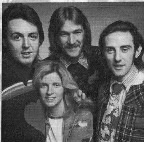
Wings 1971 : de g. à dr. Paul et Linda McCartney, Denny Seiwell et Denny Laine

Évidemment, j'attends toujours avec impatience le coffret de Wings comprenant des titres inédits, en spectacle, des maquettes et autres chansons parues commercialement mais qui n'ont pas été édités en format disque compact. Il nous est promis pour Noël 2001, mais avec Wingspan , nous avons quelque chose de substantiel à nous mettre sous la dent en attendant!