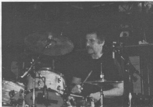
Pete Best lors de son spectacle au Hard Rock Café le 19 septembre 1996